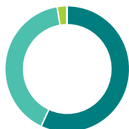
Répartition de l'actif (%)