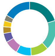
Répartition géographique (%)