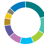
Répartition sectorielle (%)