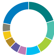
Répartition géographique (%)