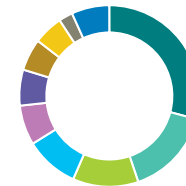
Répartition sectorielle (%)