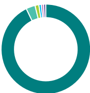
Répartition géographique (%)