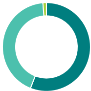
Répartition de l'actif (%)