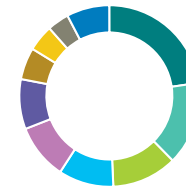
Répartition sectorielle (%)