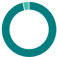
Répartition de l'actif (%)