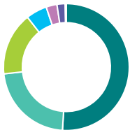
Répartition de l'actif (%)